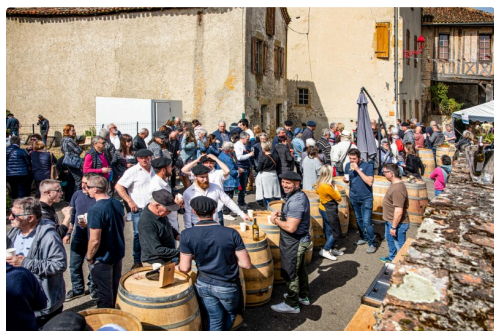
Dégustation dans la rue à Saint-Mont