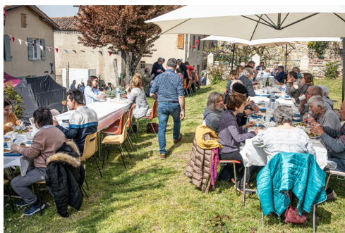
Déjeuner aux tisons dans Saint-Mont