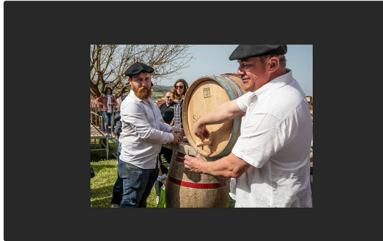
Ouverture de «Vignoble en fête» et mise en perce à Saint-Mont

Les festivités du Vignoble en fête organisées par Plaimont Producteurs dans les villages producteurs de l'appellation Saint Mont ont répondu aux attentes de la nombreuse foule en liesse qui s'est retrouvée dans la joie et la bonne humeur par un grand soleil.