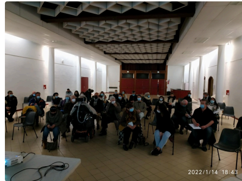
marciac la créative comité de pilotage