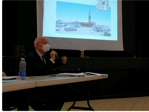
Marciac la Créative