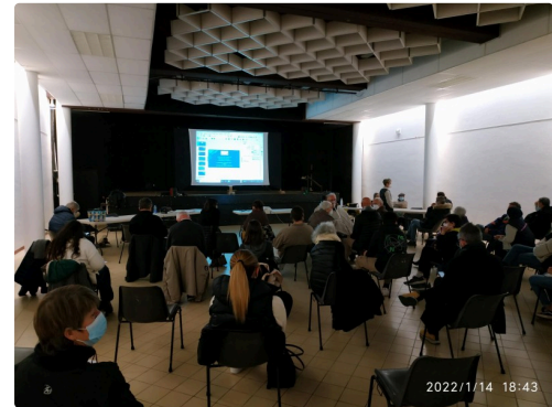
réunion de janvier 2022