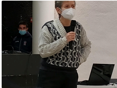
projet de MEDIEVAL ADFP Marciac