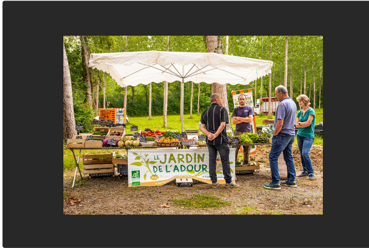
Portes ouvertes demain samedi 19 mars au jardin de l'Adour à Cahuzac-sur-Adour

Début d'une synergie avec d'autres producteurs locaux