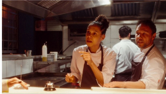
"The chef" au cinéma mardi soir