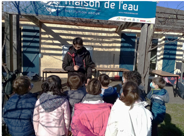
La Maison de l'Eau pour une découverte ludique de la Nature.

Les élèves de l'école primaire ont apprécié