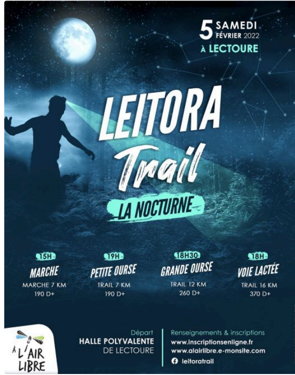
Leitora Trail Un trail nocturne à Lectoure!

L'association "A l'air libre" organise un trail nocturne le samedi 5 février 2022.