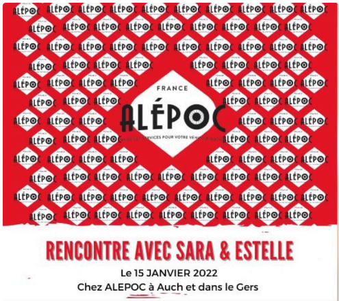
4l trp alepoc.JPG