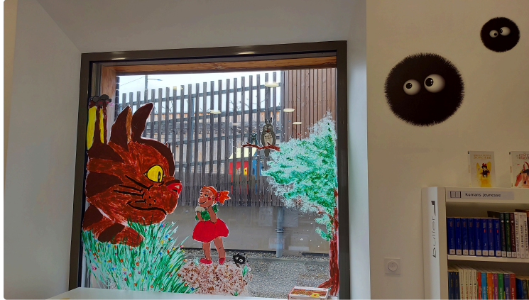
La légende du cinéma d'animation, Hayao Miyakazi, à l'honneur cette année à la Médiathèque

Dès que l'on pénètre dans l'espace « jeunesse » de la médiathèque, le ton est donné !