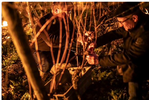
Cueilleurs au travail