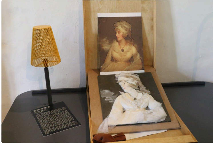
Venez jouer en famille avec l'art et le patrimoine !

Grâce à l'espace jeune récemment créé à l'Abbaye de Flaran