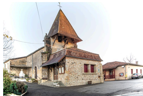
Eglise à Lelin-Lapujolle, avec la mairie au rez-de-chaussée ; à droite, la salle des fêtes