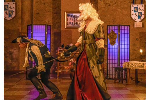
Il a osé défier le fameux chevalier d'Eon