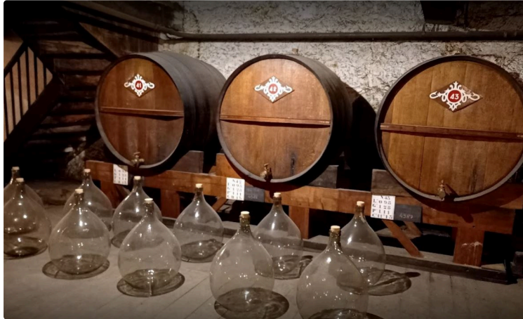
Armagnac, liqueurs, apéritifs, bières La Maison Aurian recrute

La Maison Aurian est une entreprise de liqueur qui recrute régulièrement en intérim, vous pourriez en faire partie !