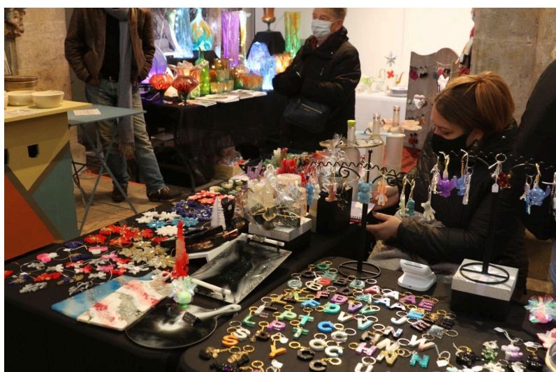
Du solide et du liquide !