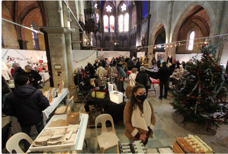
Encore un jour pour profiter du marché de Noël à l'Espace Saint-Michel

Un des projets de l'actuelle municipalité est de rebooster les comités de quartier mis en place il y a tout juste une dizaine d'années sous la mandature de Bernard Gallardo. Huit comités avaient été alors constitués pour transmettre des propositions auprès de la municipalité dans des domaines liés à l'urbanisme, l'éclairage public, la voirie, le fleurissement, la circulation et le stationnement, mais aussi la sécurité et surtout l'animation. Pour ce dernier point, le comité de quartier n°4 n'avait pas perdu de temps puisqu'il avait rapidement créé ce marché de Noël qui a su séduire son public avec une fréquentation qui ne se dément pas.