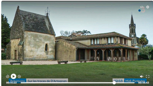
Ex-Chapelle Notre-Dame de la Pitié