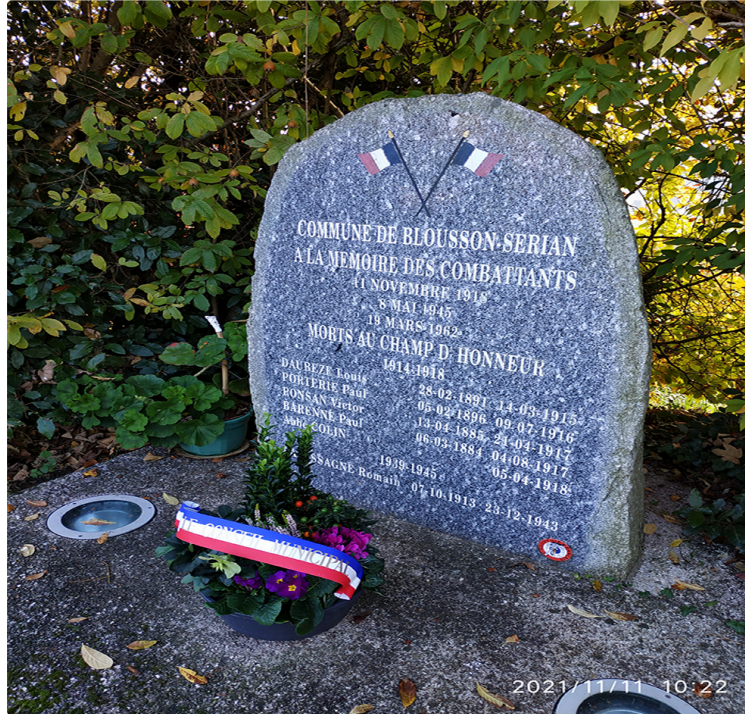
14/18 sur les traces d'enfants du pays devenus avec le temps presque anonymes