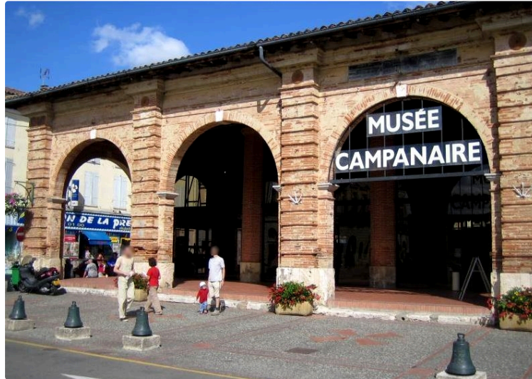
Une animation artistique au Musée Campanaire

Un corps qui s'élançe, gestes qui créent des formes, formes qui naissent à travers le contact de la matière... Cela peut réveiller en vous, une émotion, qu'elle soit positive ou négative. Pour découvrir cela, il suffit de venir cette semaine au Musée Campanaire. En effet, ce mercredi 24 novembre à 14 h 00, une des artistes, Mylène Marty, sculpteur, ayant remporté le prix de la ville 2021 des "Muses d'Europe", sera présente et proposera un atelier de démonstration de son travail.