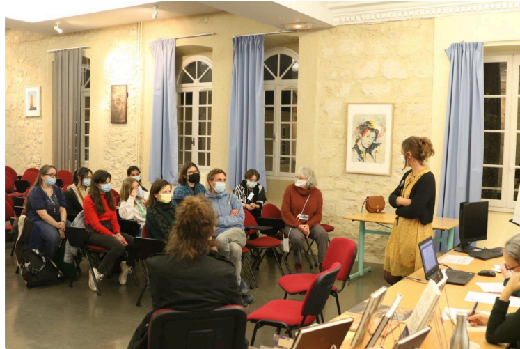
Une assemblée générale pour découvrir Art' Boss

L'association du Lycée Bossuet pour ouvrir les élèves au monde de l'art