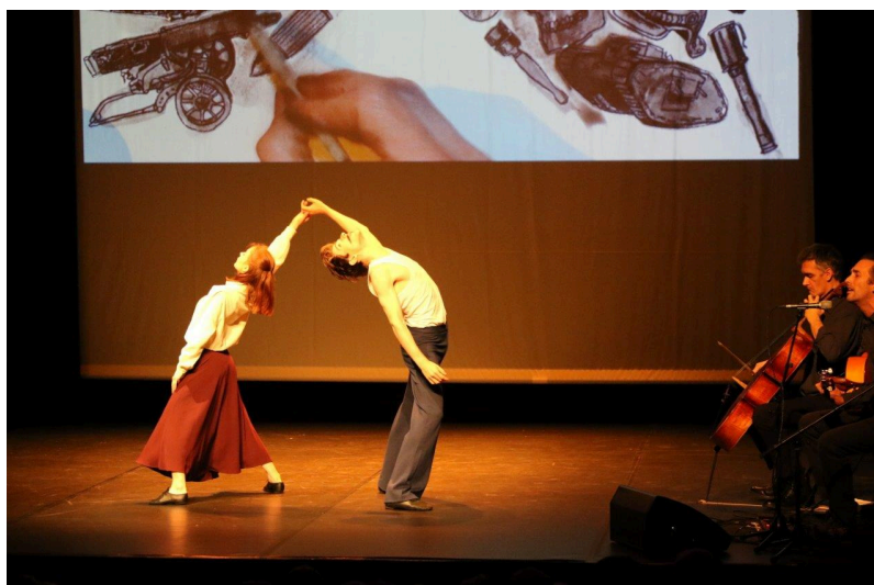
Le dessin de Guillaume Trouillard réalise le décor en fond de scène.