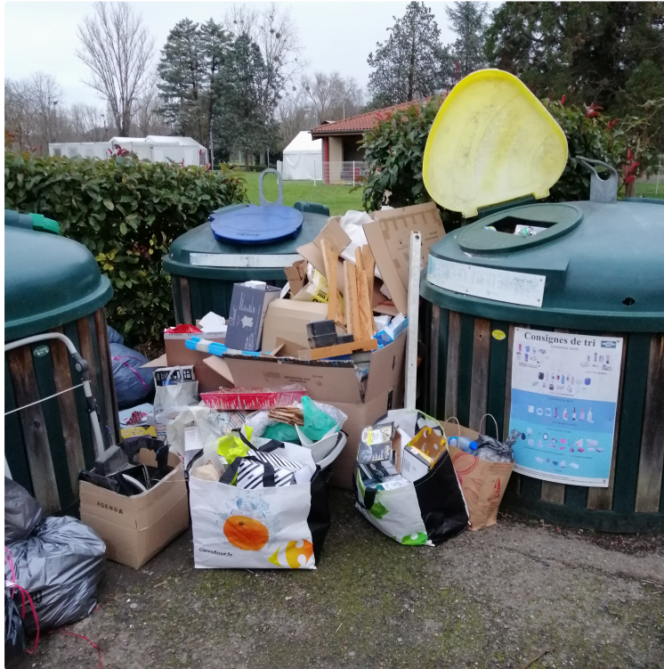
Incivisme quand tu nous tiens...

Dans le bulletin municipal qui est en cours de distribution, une page est consacrée au rappel des sanctions en cas d'incivilités.