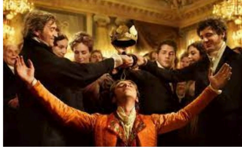
"Illusions perdues" au cinéma vendredi soir

Vendredi soir, à 21h, Illusions perdues de Xavier Giannoli avec Benjamin Voisin, Cécile de France, Vincent Lacoste ( 2 h 30 )