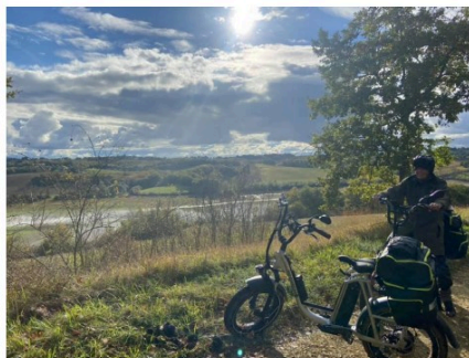
Ils ont testé la partie Gers de la route européenne d'Artagnan!

Premier itinéraire de randonnée équestre européen, la Route Européenne d'Artagnan relie Lupiac à qui a vu naître le héros légendaire, à Maastricht aux Pays-Bas, lieu de sa mort.