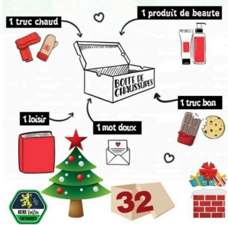
Noel et soloidarité 2021 (2).jpg