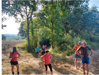
Venez «courir pour les gentlemen» avec Les Galopins du Fezensac !

Les Galopins du Fezensac organisent le dimanche 28 novembre à partir de 9 h30 deux courses de 7 et 11 km et une randonnée de 7 km au départ du gymnase du collège.