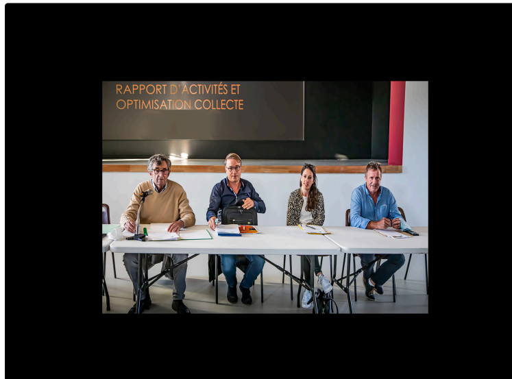
Secousses sur le Sictom Ouest en assemblée à Barcelonne-du-Gers (mis à jour le 18.10.2021)