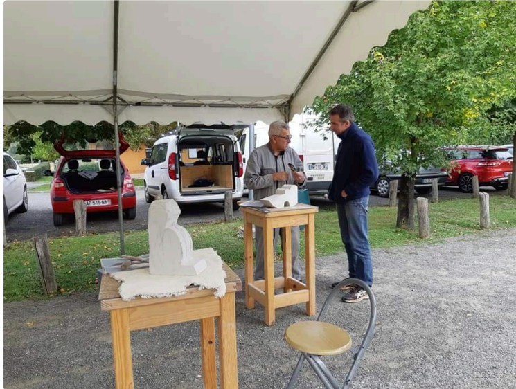
Salon d'art et symposium de la sculpture

Cette année, le salon d'art vous présente sa 24ème édition. C'est le sculpteur Alex LABÉJOF qui en sera l'invité d'honneur et qui vous fera découvrir son univers de pierre et de fer. Ces œuvres jouent sur des contrastes lisse/rugueux, lumière/ombre, fragile/solide, courbe/droit et plein/vide, affirmant ainsi la nécessité des différences pour tendre à une possible harmonie.