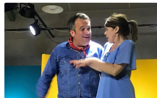
czerniak trie 1.JPG