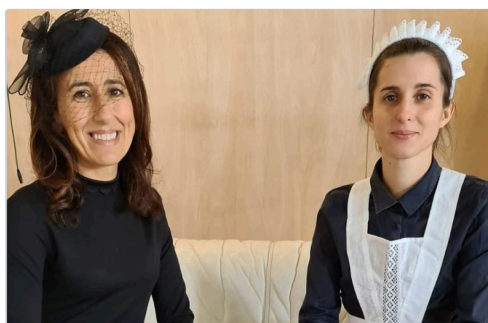
czerniak trie 6.JPG