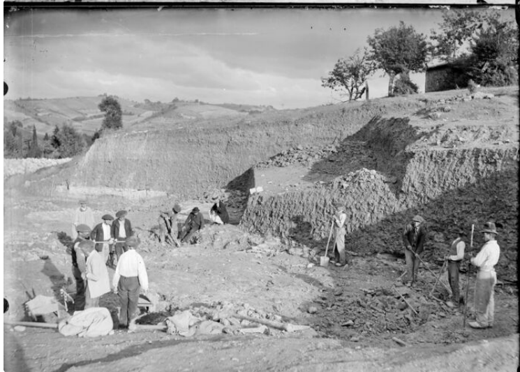
Conférence aux Archives départementales du Gers

« Edouard Lartet, de la révolution du singe à l'homme de cro-magnon » Jeudi 30 septembre 2021 de 18h à 19h30