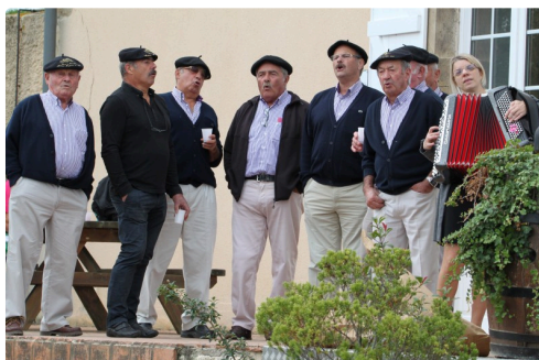
Les Chanteurs vigneron du Vic-Bilh