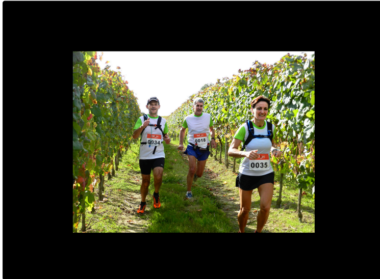
La Foulée du Madiran, c'est dimanche 10 octobre

Un grand bol d'air à travers le vignoble