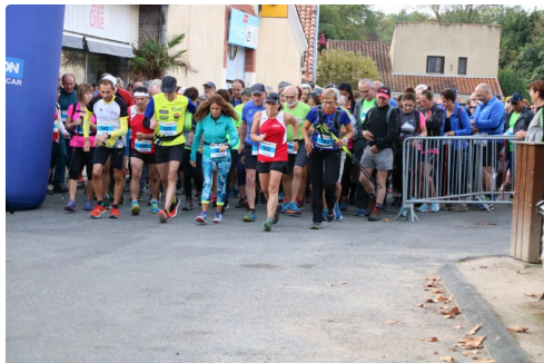
Départ de course