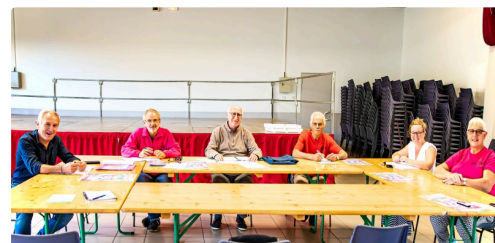
Les organisateurs lors du point de presse le 24 septembre