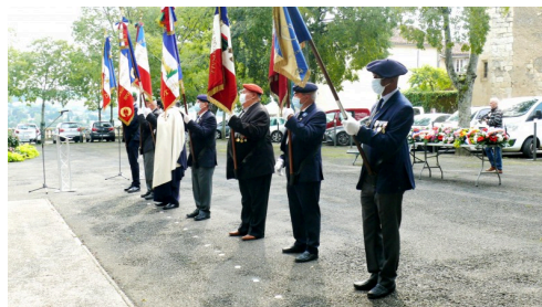
et autres porte-drapeaux.