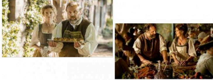
"Délicieux", l'histoire du premier restaurant au cinéma samedi soir

Si vous ne l'avez pas vu lors de sa sortie nationale, Cine Qua Non vous propose samedi à 21 h le film Délicieux de Eric Besnard avec Grégory Gadebois, Isabelle Carré et Benjamin Lavernhe