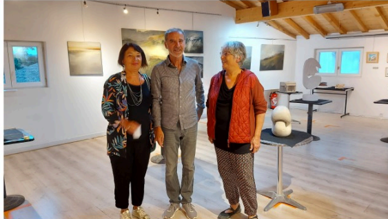
Une exposition d'exception à La Varangue

Lieu multi-culturel vicois, la Varangue met souvent à l'honneur des artistes lors d'expositions dans ses locaux.