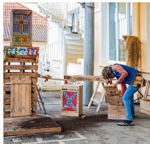
Le truand creuse la mauvaise tombe