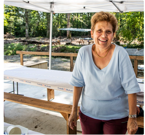
La dame qui a (très bien) servi le repas