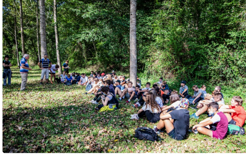
Les lycéens sont en place