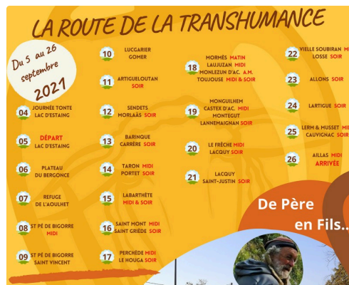
Programme de passage du troupeau