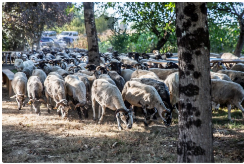
Arrivée du troupeau au pré au Musée du Paysan gascon de Toujouse