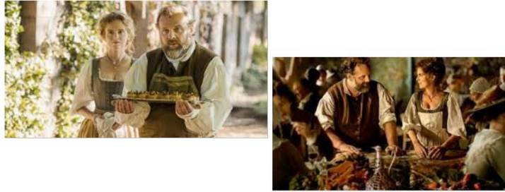
Le film "Délucieux", l'histoire du premier restaurant, en sortie nationale

En sortie nationale, Cine Qua Non vous propose jeudi à 21 h le film Délucieux de Eric Besnard avec Grégory Gadebois, Isabelle Carré et Benjamin Lavernhe