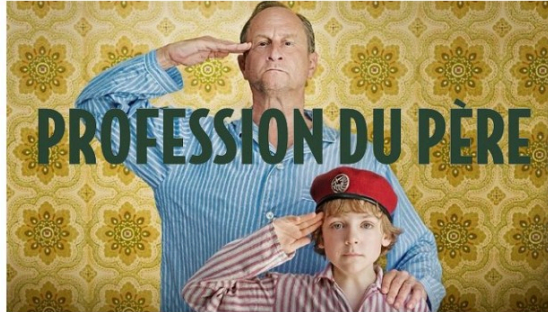
"Profession du père" au cinéma mardi soir

Mardi soir à 21 h , Cine Qua Non diffuse Profession du père , un drame de Jean-Pierre Améris avec Benoît Poelvoorde (1 h 45 )