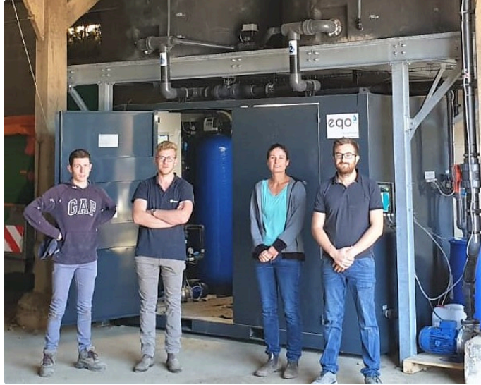
EQO, l'entreprise gersoise qui révolutionne les traitements phytosanitaires

L'idée est excellente, encore fallait-il y penser. Et surtout, être "du métier" pour trouver une réponse pertinente au nouvel objectif du plan Eco Phyto II, qui ambitionne 50% de réduction des usages de pesticides d'ici 2030. Ce plan, issu du Grenelle de l'environnement, n'en était alors qu'à sa première étape, lorsque la société EQO a vu le jour en terre gersoise.