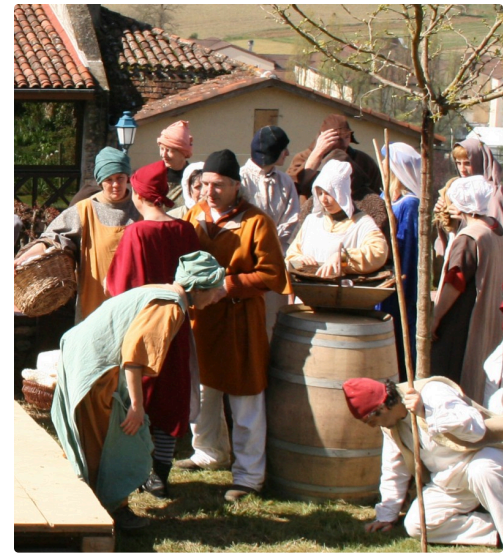
Habits moyenâgeux 2 290308.jpg