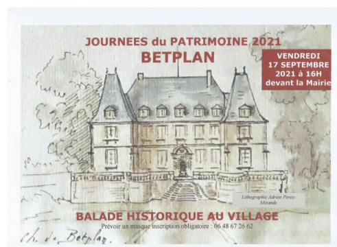
Betplan Journée du Patrimoine 2021.

Pour ceux qui ne le possède pas encore, les conférencières dédicaceront leur livre « Betplan 1419-2019 », Cet ouvrage retrace le résultat de leurs recherches dans près de 200 pages, dans une rédaction claire agrémentée de plans et photos. Cette monographie est un ouvrage qui devrait trouver sa place dans de nombreuses bibliothèques et satisfaire la curiosité des amateurs d'Histoire régionale.