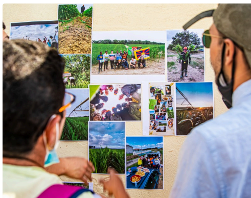
9 Devant les photos 1bis 050821.jpg