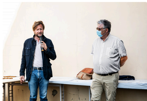
8 Intervention de Boris Vallaud 1bis 050821.jpg