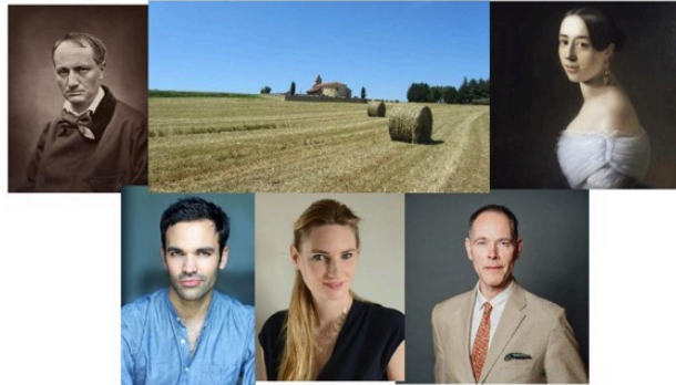
L'ASEL présente la Cie de l'Oiseleur en concert le 9 août 2021 à la chapelle de Las