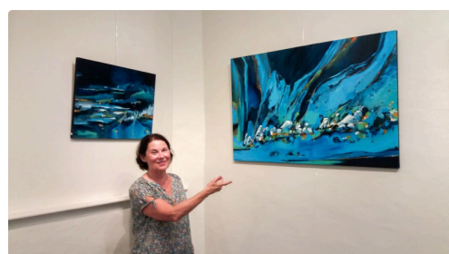
L'artiste à l'installation de son exposition

Téléphone : 06 86 95 58 77 / www.larcade-saint-clar.com