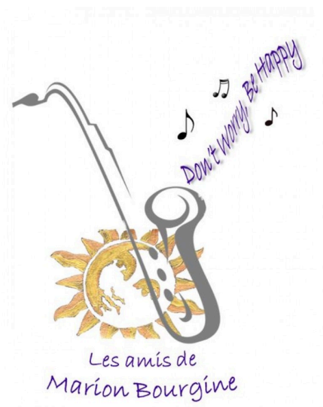
marciac marion affiche.JPG