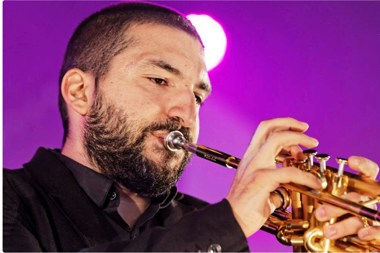
Une soirée prometteuse