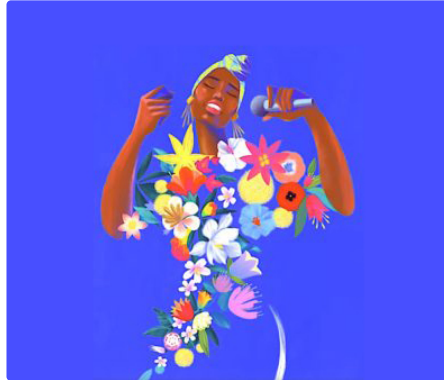
Et si, pour les Gersois, c'était la bonne année pour découvrir le festival JIM