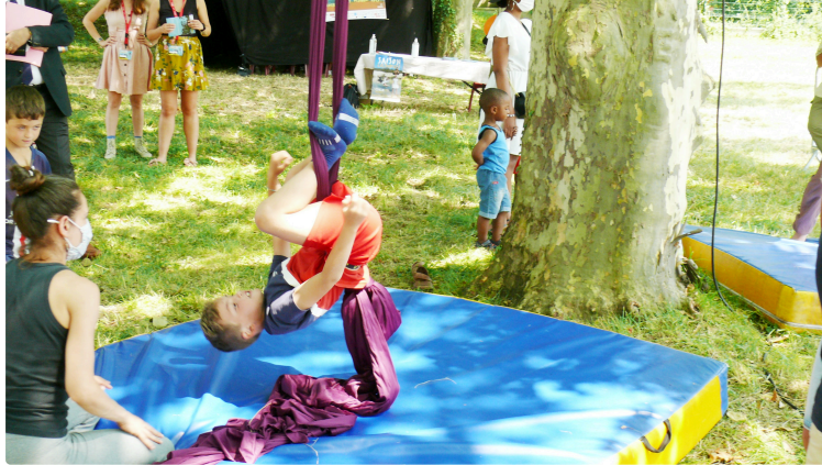
La Boubée au Garros sait se rendre attractif

Il ne manquait plus que le chant des cigales au parc de la Boubée au Garros ce mercredi 21 juillet après-midi pour mieux apprécier l'ombre bienfaisante des dizaines de platanes. Un endroit qui proposait à de nombreux enfants dans le cadre du dispositif Plan Quartier d'été, des ateliers de cirque, marionnettes, théâtre d'ombre et Cinéma initiés par CIRC et Ciné 32.