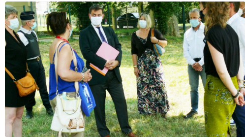
Le préfet du Gers, des représentants de l'Agglomération du Grand Auch et les équipes de CIRC et de Ciné 32 ont rendu visite aux divers ateliers.

D'autres rendez-vous sont programmés dont celui du 6 août avec un atelier Djembé et un concert.