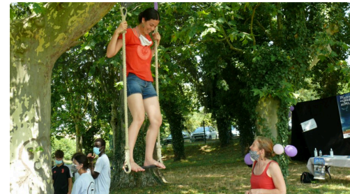
Tenir debout, le plus dur est fait...