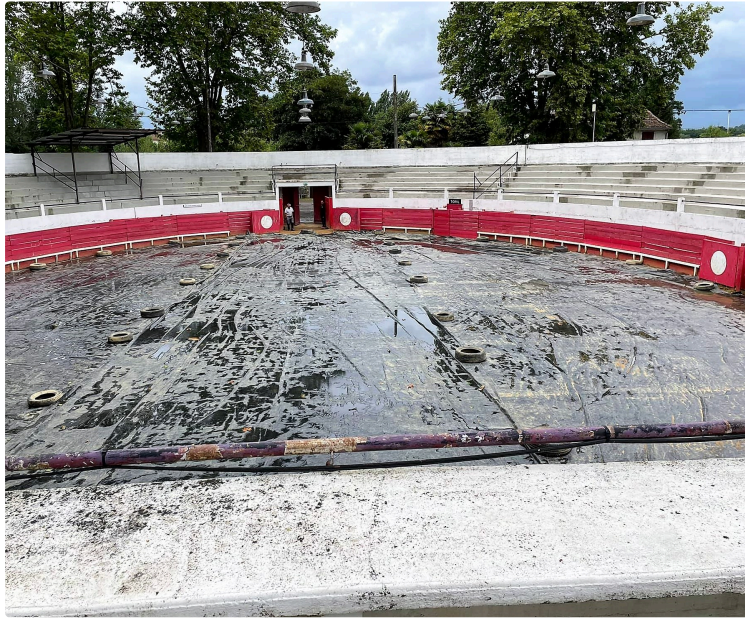
la course Landaise annulée et reportée

les conditions climatiques de ce mardi 13 juillet ont empêché le retour de la Course Landaise