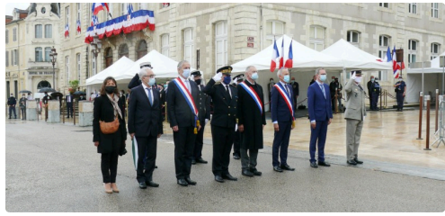
Les autorités civiles et militaires.