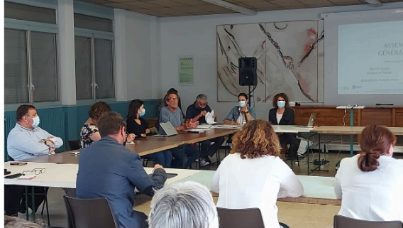
Assemblée Générale de l'Office de Tourisme d'Artagnan en Fezensac : une année 2020 difficile mais des projets ambitieux en 2021